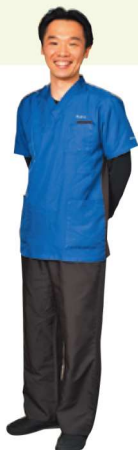
理事長・院長・歯科医師

近年、歯科医院業界ではTCという職種がクローズアップされてきています。まだまだ聞きなれない職業だと思われるかもしれませんが、当院でも歯科業界未経験のスタッフが一から勉強してTCになる場合がほとんどです。ですが今後の歯科医院業界では必ず発展していく職種だと思います。なかむら歯科クリニックでは「歯科医院で働いて誰かに喜んでもらえる仕事がしたい」「新しい職種に就いてやりがいを見つきたい」「自分で歯科医院を素晴らしいものにしていきたい」などの情熱をお持ちの方であれば大丈夫です。資格を取得する事もできますので、当院でTCを目指してみませんか？